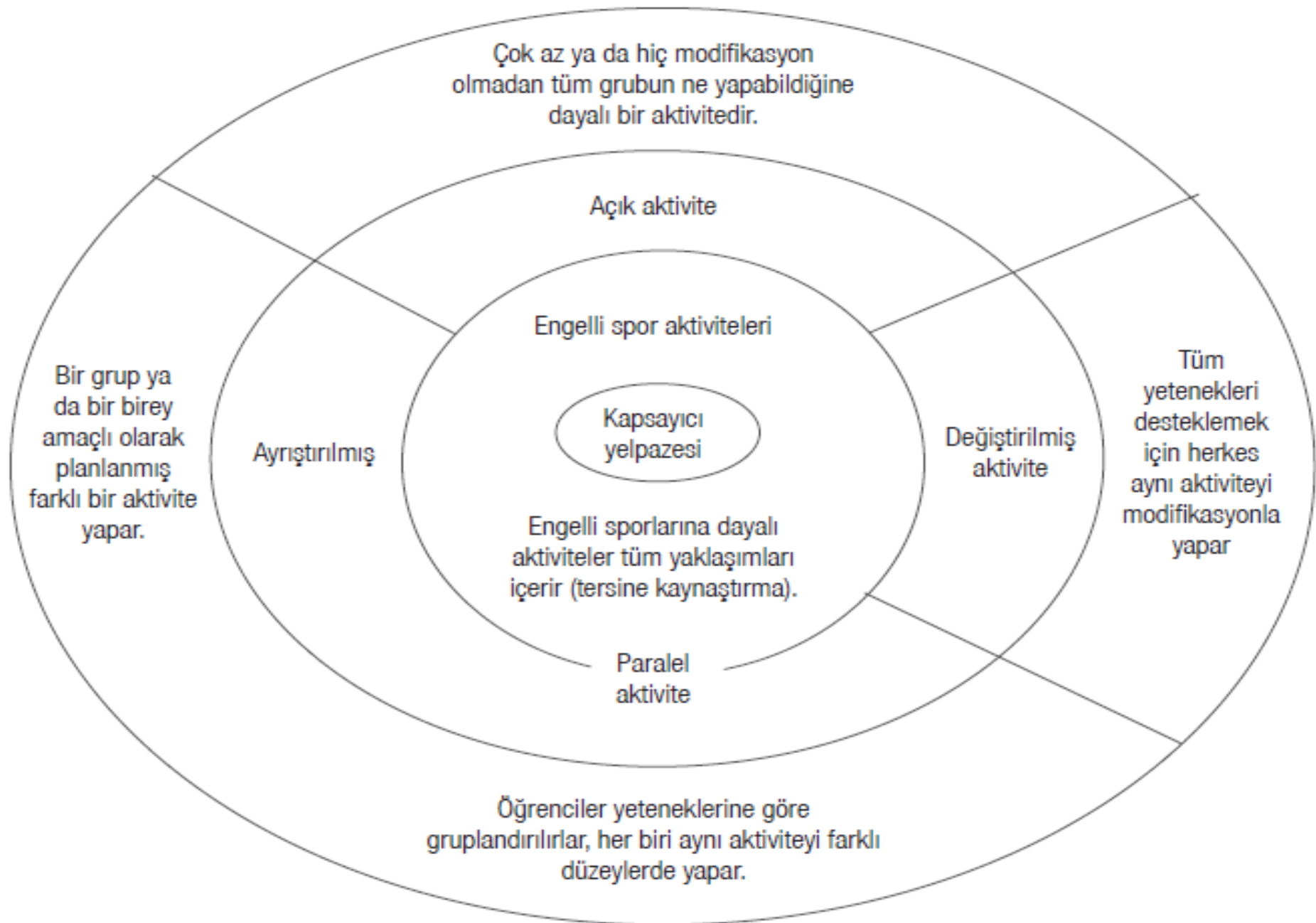
Şekil 4.1 Kapsayıcı beden eğitimi yelpazesi